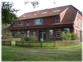
Wohngruppe Haus 2