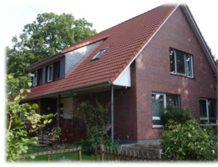
Wohngruppe Haus 4